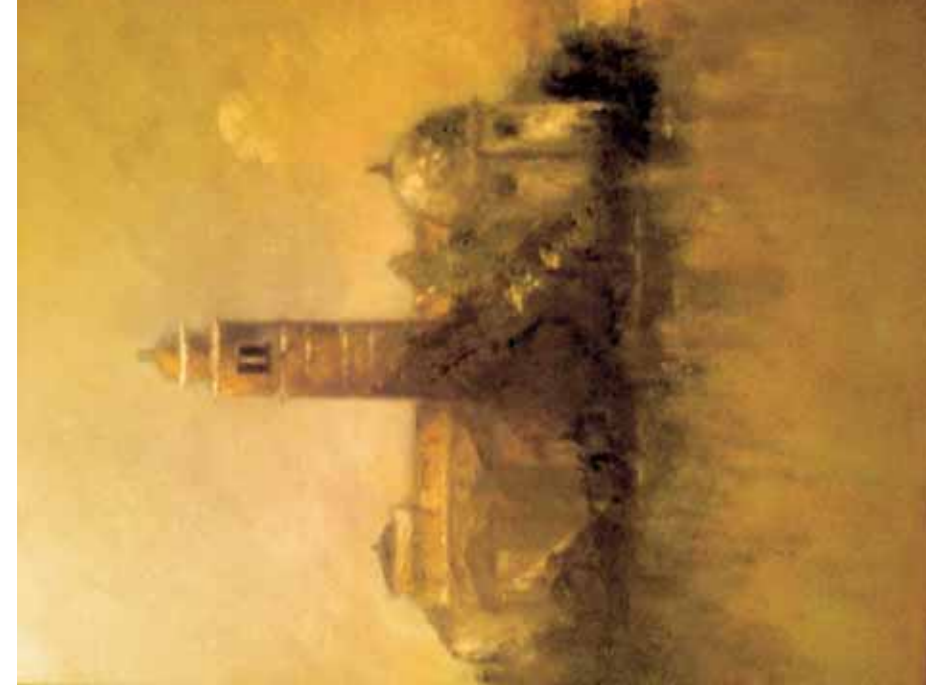
TIMOTHY ATWATER, San Michele , huile sur toile, 36 x 28 cm.