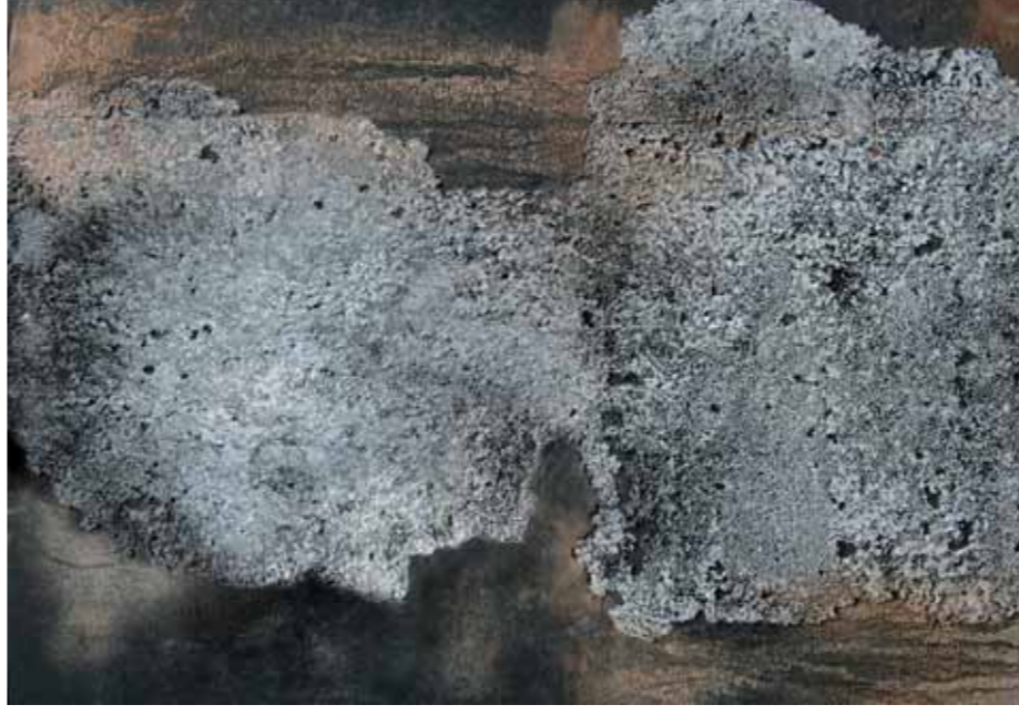
VIRIDI Ritratto di M. T. Pisacchi 2012 Technique mixte sur toile, 100 x 70 cm.