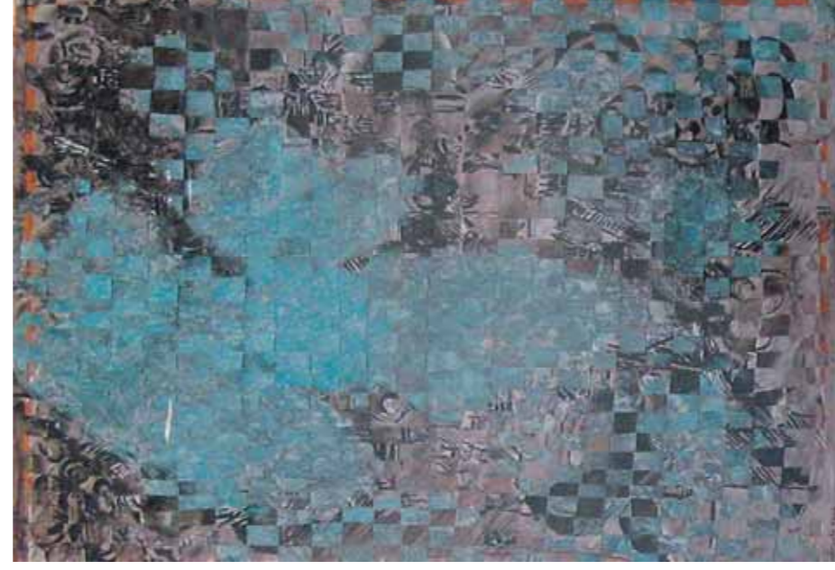
FRANÇOIS ROUAN, Mappe 2000 cire, crayon et gouache sur papiers tressés 70 x 48.5 cm.