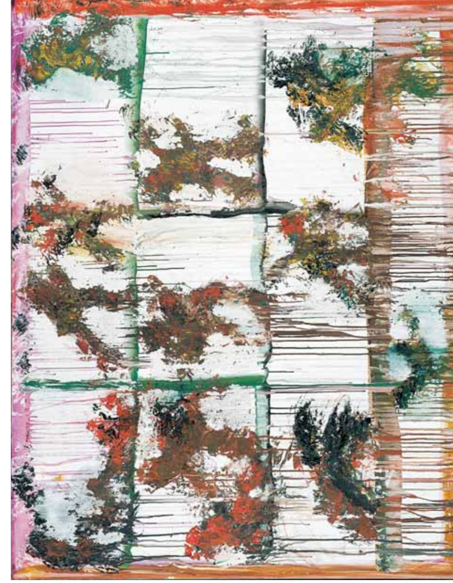
IDA BARBARICO, I Terrestri 2005, huile sur toile, 89 x 116 cm.