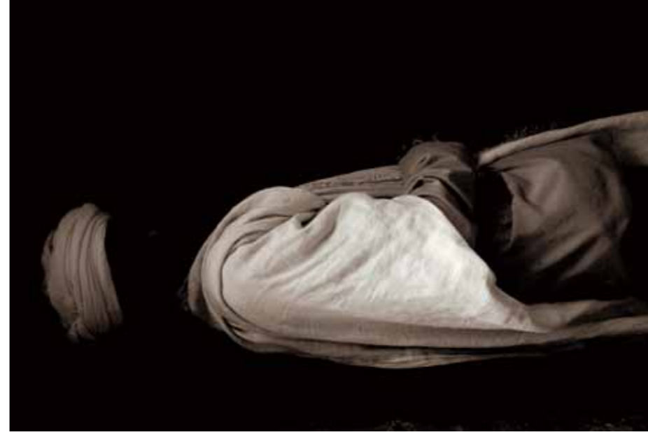
ALEXANDER ATWATER, Lalibela 2007, 82 x 57 cm.