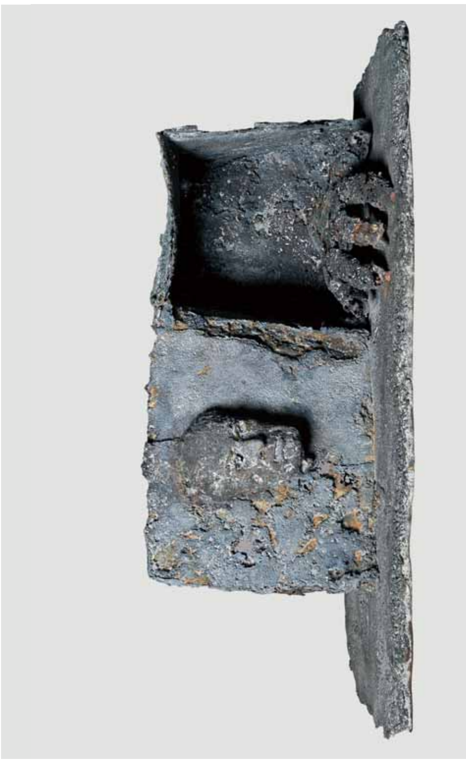
CARLO GUARENTI, Rovine 2012, bronze, 98 x 67 x 39 cm.