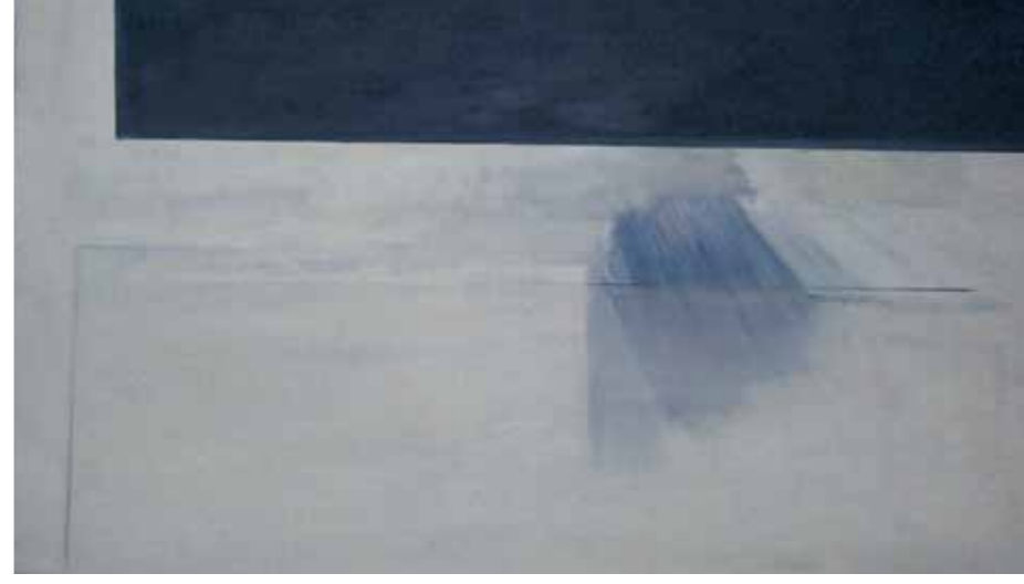
GENEVIÈVE ASSE, L'Aube 2011 huile sur toile, 65 x 100 cm.