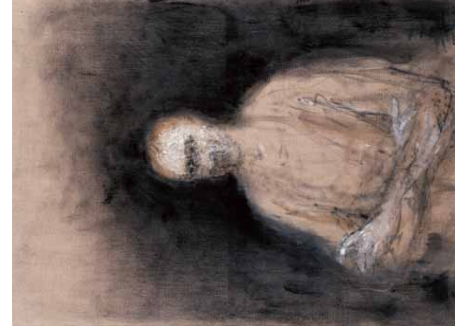
ZORAN MUSIC, Autoportrait 1995, huile sur toile, 100 x 73 cm.