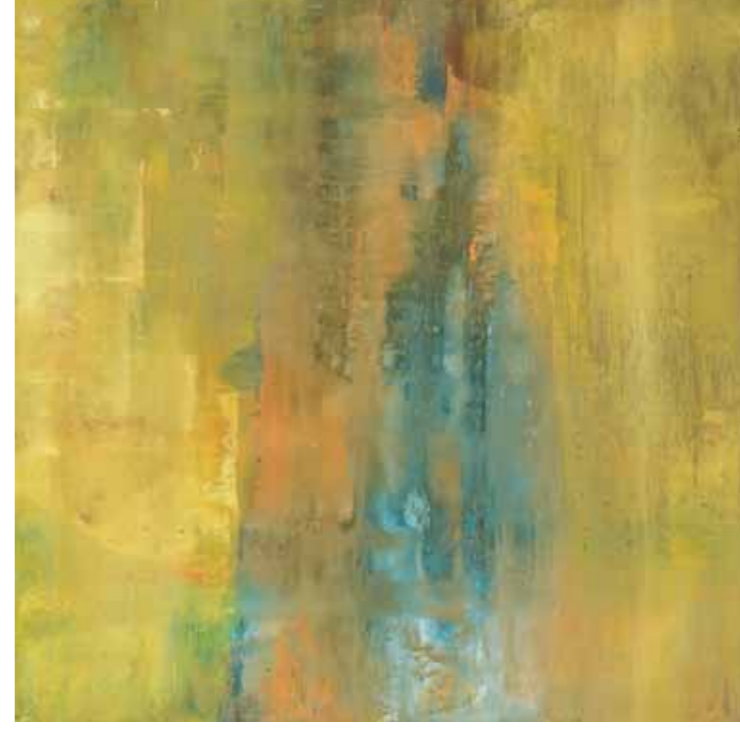
ELIAS G. BENAVIDES, Riflessi 2007, huile sur toile, 40 x 40 cm.