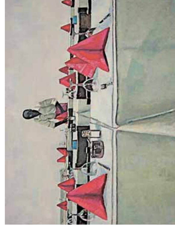
MARC-ANTOINE FEHR, Cooperativo 2008, huile sur toile 20x150cm