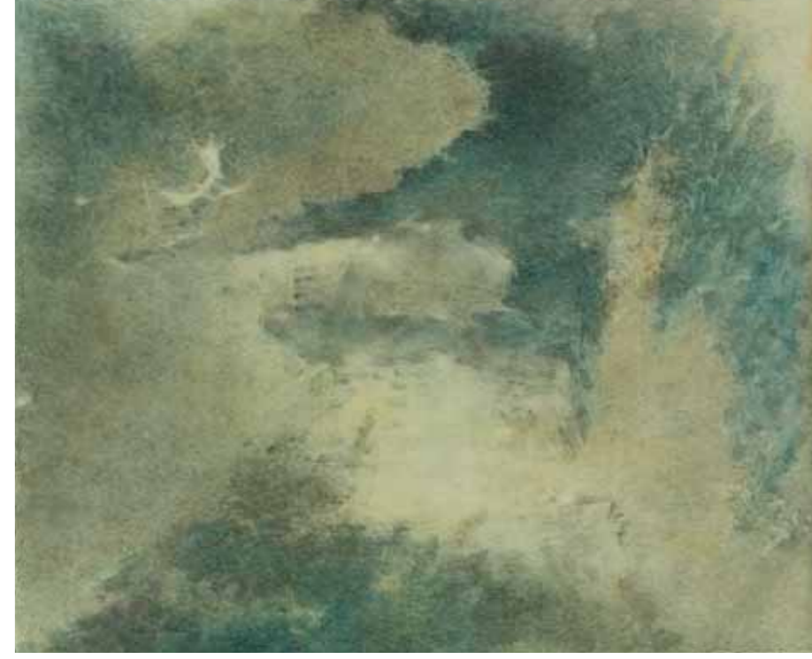
MARIE-ANNE PONIATOWSKA, Ruine américaine 2003, technique mixte sur papier, 101 x 82,5 cm.