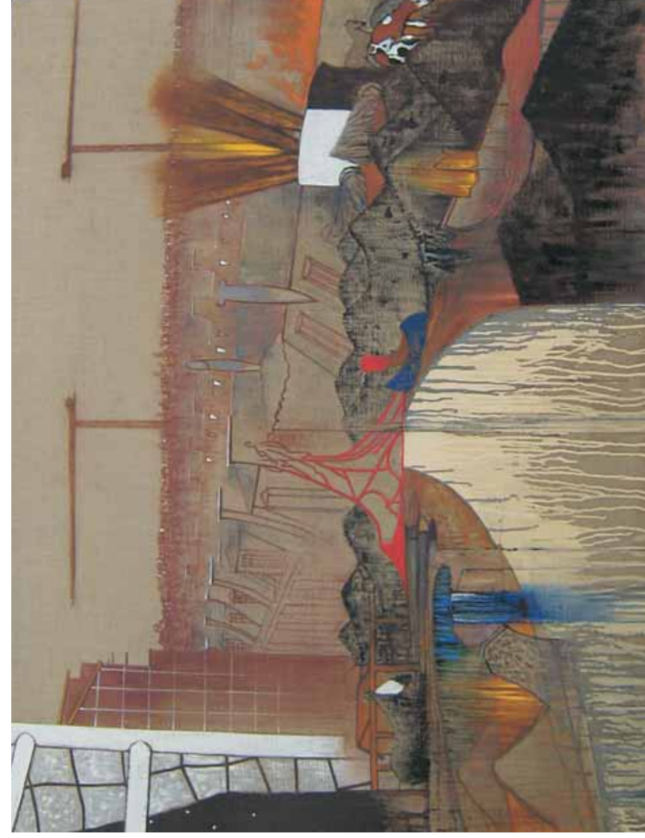
IRVING PETLIN, Europa 1999, huile sur toile marouflée sur bois, 120 x 160 cm.