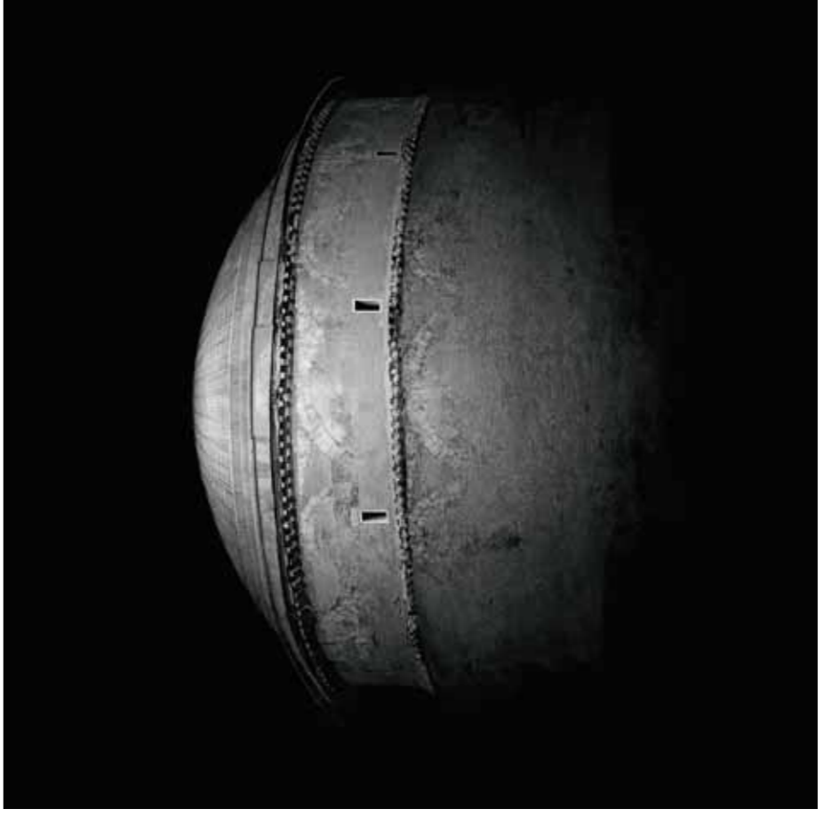
IRENE KUNG, Pantheon 2 2007, D-print, 100 x 100 cm.